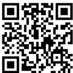
QR code à scanner