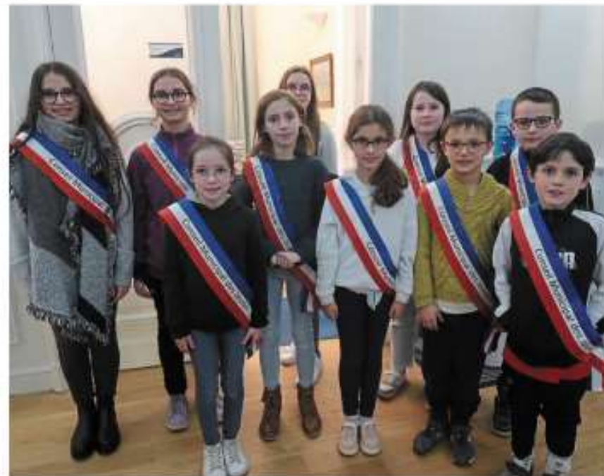
Le conseil municipal des jeunes a présenté aux élus adultes son bilan 2023 et ses projets pour 2024.

Ainsi, cinq projets ont été retenus : « Nous souhaitons organiser un événement festif sur le thème "Beaufort à un incroyable talent". Après notre visite de Restoria, nous souhaitons modifier et choisir un ou plusieurs menus de la cantine. Nous souhaitons apporter des jouets dans les hôpitaux, réfléchir à la sécurité routière aux abords des écoles et aux déplacements à vélo, et réaliser des hôtels à insectes. » Un beau programme donc, que les jeunes élus