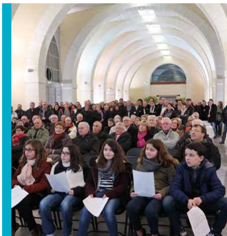
Les vœux en images