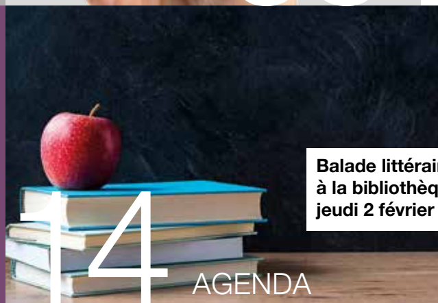
Balade littéraire à la bibliothèque jeudi 2 février