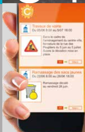
Citykomi : une nouvelle application mobile au service des habitants