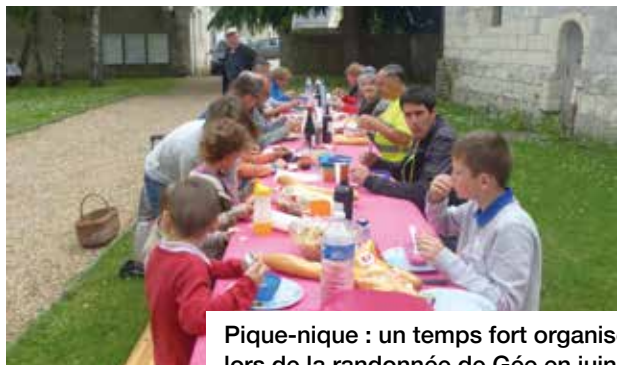
Pique-nique : un temps fort organisé lors de la randonnée de Gée en juin

En mars 2014, nous étions loin de la commune nouvelle. Mais aujourd'hui, nous pouvons affirmer que nous allons réussir, tous ensemble. Et que nos 2 communes constituent le cœur de ville pour que celui-ci batte à l'unisson.