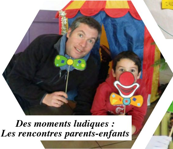
Des moments ludiques : Les rencontres parents-enfants