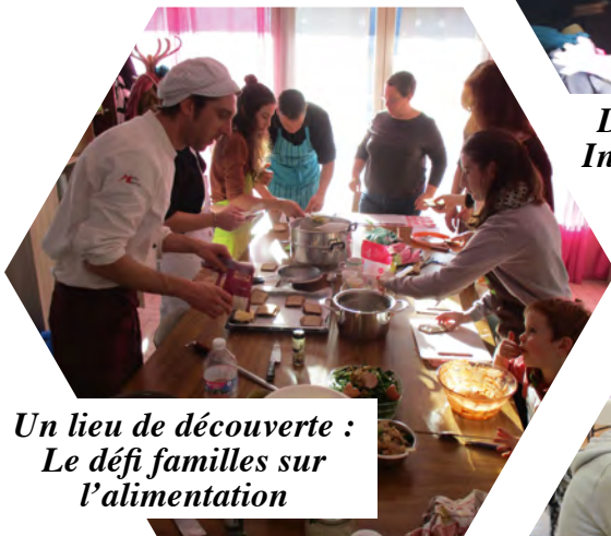
Un lieu de découverte : Le défi familles sur l'alimentation