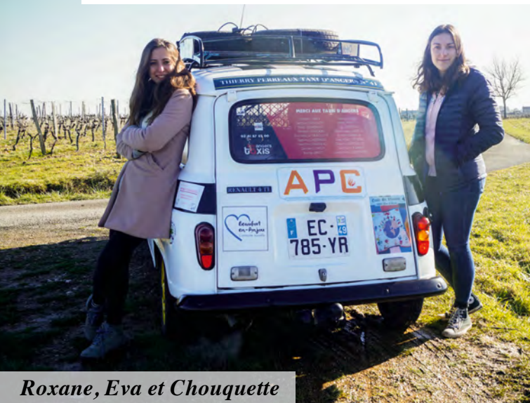
Roxane, Eva et Chouquette

La ville soutient régulièrement ses jeunes qui s'engagent dans des missions humanitaires. Dernièrement, trois jeunes femmes sont parties, deux sur le 4L Trophy et la troisième auprès de l'association Mission Humanitaire.