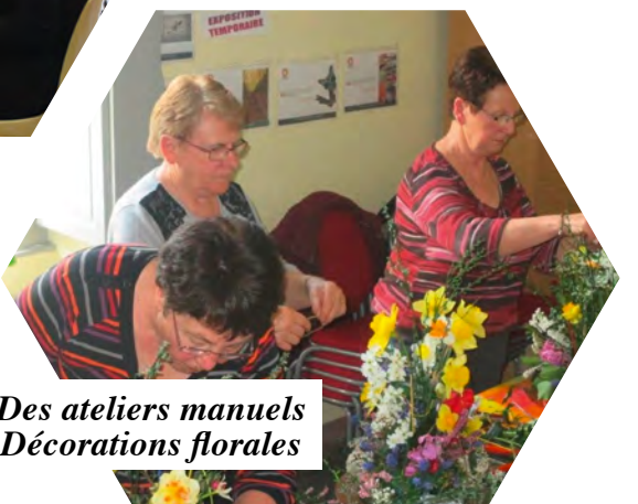
Des ateliers manuels Décorations florales