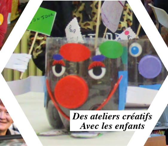
Des ateliers créatifs Avec les enfants