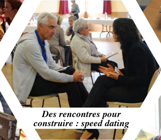
Des rencontres pour construire : speed dating