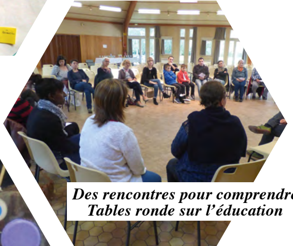
Des rencontres pour comprendre Tables ronde sur l'éducation