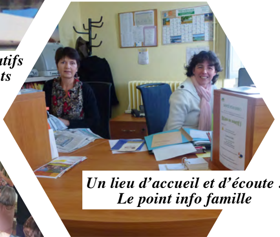
Un lieu d'accueil et d'écoute : Le point info famille