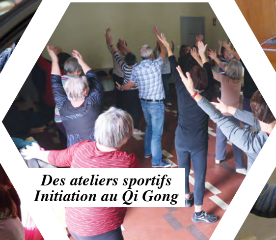
Des ateliers sportifs Initiation au Qi Gong