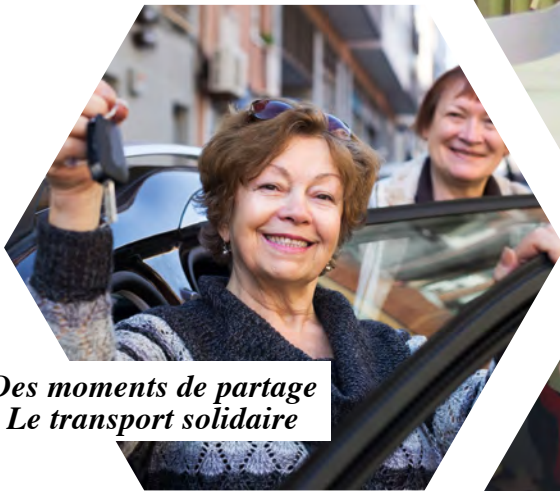
Des moments de partage Le transport solidaire