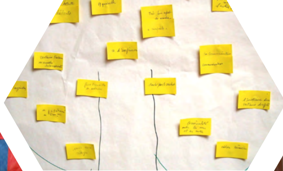
Un lieu d'expression : La construction du projet