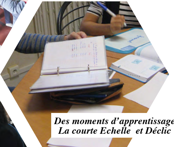
Des moments d'apprentissage La courte Echelle et Déclic