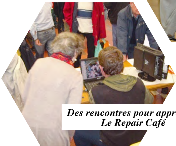
Des rencontres pour apprendre Le Repair Café