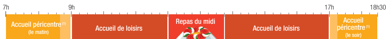
Frise d'une journée type en péricentre le mercredi.

Je souhaiterais pouvoir travailler avec les élus, les acteurs éducatifs et notre tissu associatif local afin de proposer une semaine d'école de 5 jours où les enfants seraient moins sollicités, donc plus attentifs et plus détendus. Cinq matinées à l'apprentissage scolaire et cinq après-midi consacrés au sport, à la culture, à la découverte d'entreprises et de métiers selon les âges des enfants. En résumé proposer des activités de qualité l'après-midi. Quoi qu'il en soit, les rythmes scolaires soulèvent de nombreuses questions, le dossier n'est pas clos. Le Recteur et le Directeur d'académie sont à notre écoute et prêts à nous accompagner dans nos réflexions.