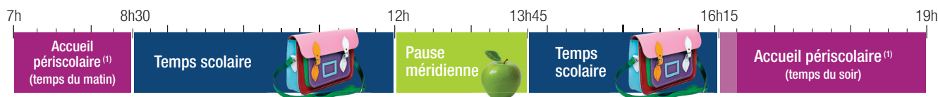
Frise d'une journée type à l'école.

La rentrée scolaire aura lieu le jeudi 2 septembre à 8h30 pour tous les élèves de Beaufort-en-Anjou.