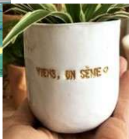
Tasses, Pots de fleurs