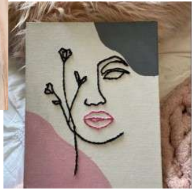
Broderie sur toile