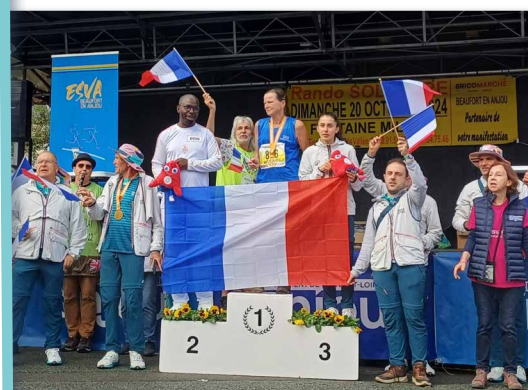
Délégation post-olympique 2024

Environ 50 jeunes ont participé à l'animation enfants.