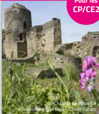
Château de Pouancé

Pendant ce séjour, les enfants vivent une véritable immersion entre aventures et découvertes. Ils s'initient à la sarbacane pour tester leur précision, explorent un château et ses secrets, et réalisent leur propre vitrail, comme de véritables artisans d'autrefois. Un séjour complet pour voyager dans le temps !